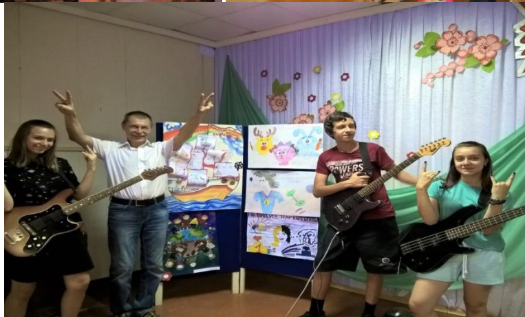
Рок-концерт «Мы – против наркотиков!!!» (МАУ ДО ДДТ Октябрьского района, 2024 г.)