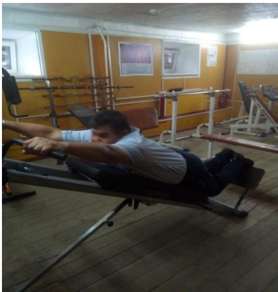
Хорошее здоровье-путь к успеху!