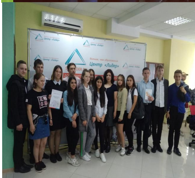
Реализация проекта программы городской инновационной площадки по теме: «Формирование духовно-нравственного воспитания в системе дополнительного образования» (2023-2024 гг.)