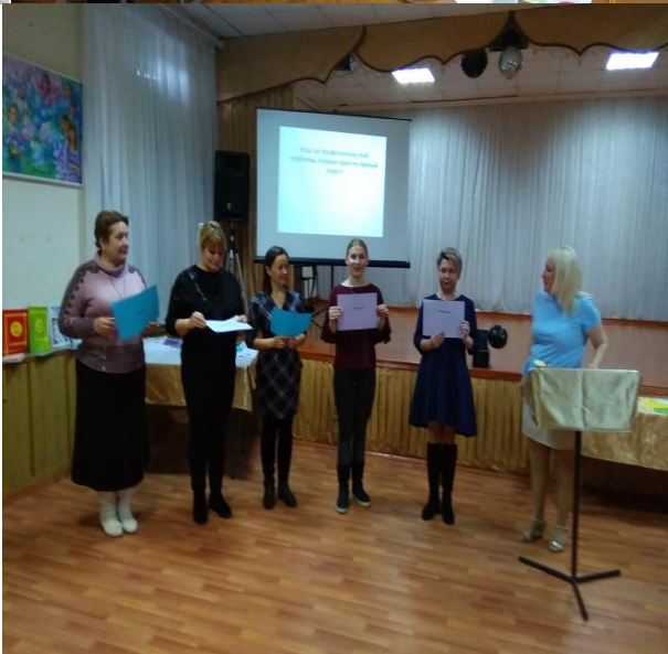
Открытый городской научно-практический семинар по инновационной деятельности «Формирование здоровьесберегающей среды как средства повышения эффективности учебно-воспитательного процесса в Доме детского творчества» (промежуточный отчет ГИП, 2023 г.)