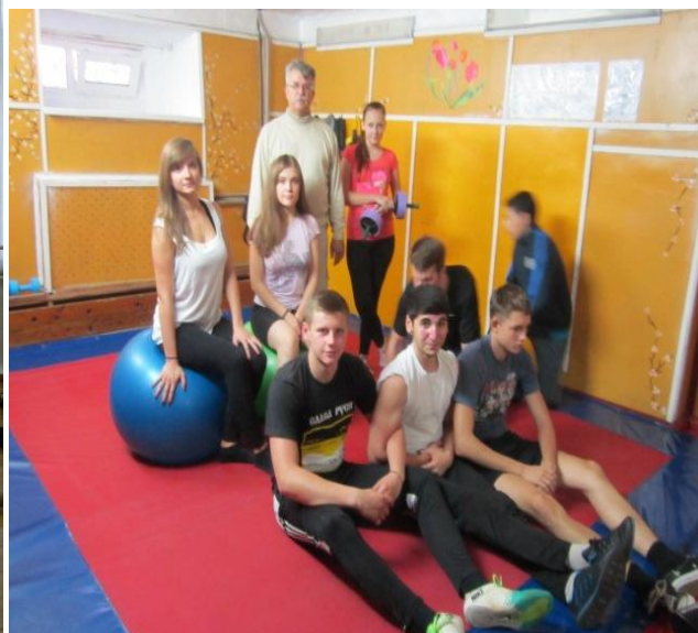
Реализация проекта программы городской инновационной площадки по теме: «Формирование целостной системы культуры здорового образа жизни обучающихся в системе дополнительного образования» (2020-2022 гг.)